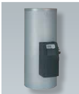
Vitocell 100-B s předem namontovaným Solar-Diviconem.

Vitosol 100-FM (typ SVKF) pro montáž na střechu.