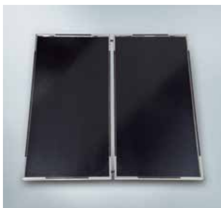
Ploché kolektory Vitosol 100-FM (typ SVKF).

Inteligentní absorpční vrstva chrání kolektory před přehříváním. Technika ThermProtect patentovaná firmou Viessmann vypíná při dosažení určité teploty sluneční kolektory. Při teplotách nad cca 75 °C se mění krystalická struktura absorpční vrstvy, mnohonásobně se zvýší tepelné sálání a sníží se výkon kolektoru. Maximální teplota v kolektoru tak zůstane podstatně nižší a zamezuje se tvorbě páry v solárním okruhu.