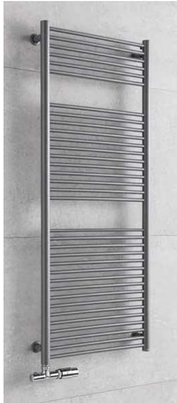
TAIFUN TS4MS provedení metalická stříbrná 600 × 1210 mm