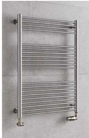
TAIFUN TS1C – provedení chrom 500 × 790 mm