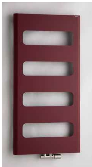
RETRO RTRE – provedení bordó (strukturální barva) 600 × 1200 mm