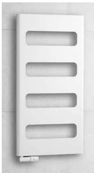
RETRO RTWE – provedení bílá (strukturální barva) 600 × 1200 mm